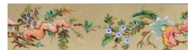
Multicolori Oriente su oro