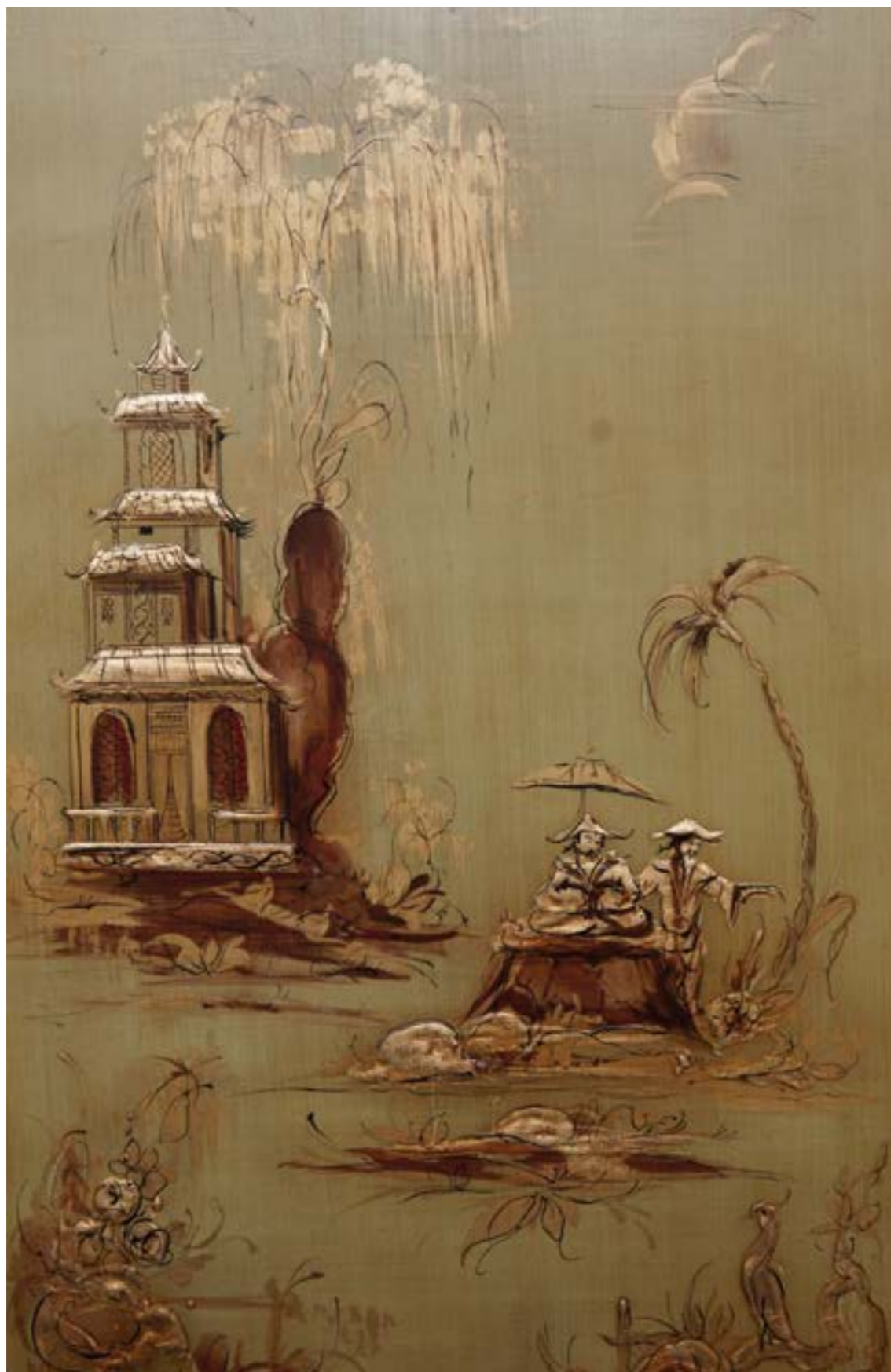
Gobi Pannello decorativo in legno. Decoro Verde Antico Chinoiserie. Pittura a mano con pastiglia e mecca.