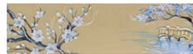
Blu e bianco Oriente su oro