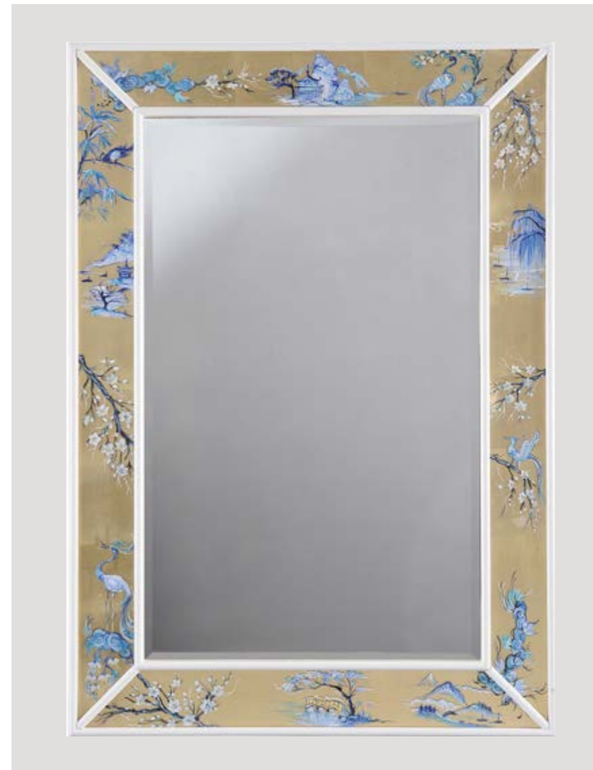
Yoko art. 21550 cm 76x117h. Specchiera in legno. Decoro Blu e bianco Oriente. Pittura a mano su vetro, fondo oro a foglia.

Colori e misure personalizzabili su richiesta.