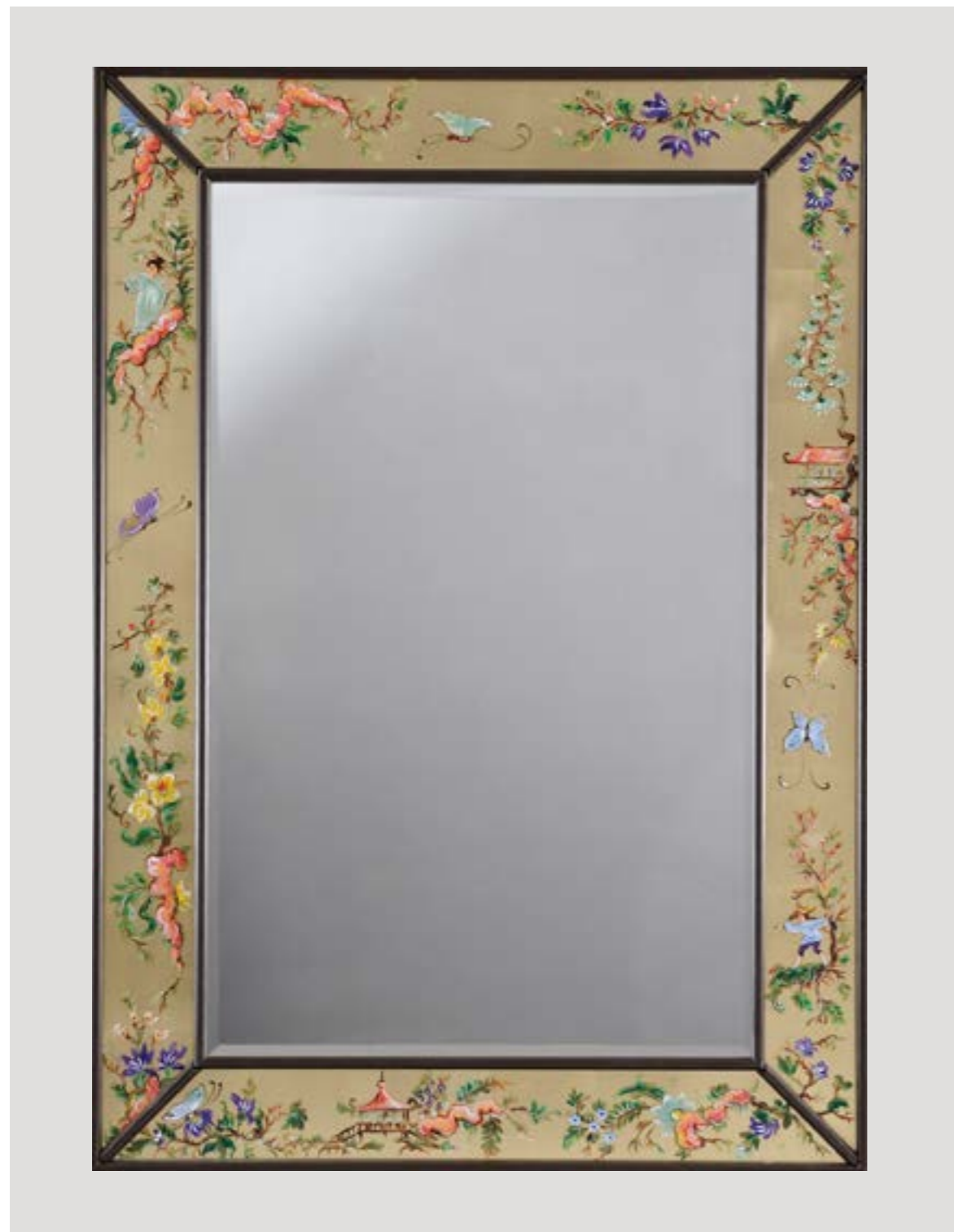
Rumi art. 21539 cm 76x117h. Specchiera in legno. Decoro Multicolori Oriente. Pittura a mano su vetro, fondo oro a foglia.

Interamente realizzata a mano in Italia.